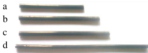
Gambar 3. Potongan pipet

Kegiatan inti dimulai dengan langkah perumusan masalah. Peneliti sebelumnya merumuskan masalah yaitu, bagaimana menemukan bahwa rumus keliling trapesium adalah K = a + b + c + d , jika diketahui trapesium memiliki panjang sisi a , b , c , dan d . Adapun kegiatan yang dilakukan pada langkah ini yaitu siswa diberikan LKS yang didalamnya terdapat langkah-langkah untuk menemukan rumus keliling trapesium dan membentuk trapesium dari pipet yang telah disediakan. Sebelumnya peneliti telah menyiapkan empat buah pipet untuk masing-masing kelompok dengan ukuran panjang 10 cm, 7 cm, 6 cm, dan 5 cm sebagaimana ditunjukkan Gambar 3. Hasil pekerjaan siswa sebagaimana ditunjukkan Gambar 4.