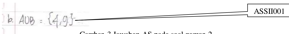
Gambar 3 Jawaban AS pada soal nomor 2

Selanjutnya, peneliti memberikan tes akhir tindakan siklus II (S2), kepada siswa kelas VII A. Tes yang diberikan sebanyak 2 nomor. Salah satu soalnya yaitu soal nomor 2; diketahui: S = \{1,2,3,4,5,6,\dots,12\} A = \{1,2,3,4,6,9\} B = \{4,5,9,10,12\} , tentukan: A \cup B . Setelah dilakukan pemeriksaan, ternyata masih ada siswa yang melakukan kesalahan dalam menjawab soal yaitu siswa AS. Jawaban siswa AS ditunjukkan pada Gambar 3.